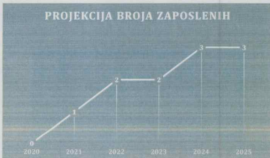
Grafički prikaz: Plan kretanja broja zaposlenih po godinama

Planirano kretanje broja zaposlenih prikazano je grafičkim prikazom u nastavku, a odnosi se na period od 2019. g. - 2024. g. Grafički prikaz prikazuje povećanje broja zaposlenih u odnosu na prethodne godine (prosječan broj zaposlenih) što je rezultat restrukturiranja tvrtke i povećanja prodaje do kojeg je došlo kroz projekciju budućeg poslovanja tvrtke.